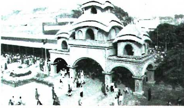
ಕಾರ್ಯಕ್ರಮಕ್ಕೆ ವಾಸಿದ್ದ ಬೃಹತ್ ಚಕ್ರವರ ಭವ್ಯ ಪ್ರವೇಶದ್ವಾರ