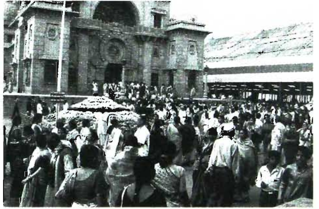
ಬೇಲೂರು ಮಠದ ಆಂಗಣದಲ್ಲಿ ನೆರೆದಿರುವ ಭಕ್ತ ಸಮುದಾಯ