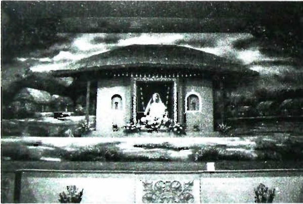
ವೇದಿಕೆಯ ಮೇಲೆ ಶ್ರೀಮಾತೆಯವರ ಅಲಂಕೃತ ಚಿತ್ರ

ಶ್ರೀಮಾತೆಯ ಅನಂತ ಗುಣಗಳನ್ನು ಹಾಗೂ ಜೀವನದ ವಿವಿಧ ಭಾವಗಳನ್ನು ಪರಿಚಯಿಸುವ ಅನೇಕ ಗೋಷ್ಠಿಗಳನ್ನು ನಾಲ್ಕನೇ ತಾರೀಖಿನ ಪ್ರಾತಃಕಾಲ ಶ್ರೀಮತ್ ಸ್ವಾಮಿ ರಂಗನಾಥಾನಂದಜಿ ಉದ್ಘಾಟಿಸುತ್ತ "ಶ್ರೀಮಾತೆ ಡಕಾಯಿತ-ಸಾಧು, ಮ್ಲೇಚ್ಛ-ಉಚ್ಛ ಎಲ್ಲರನ್ನೂ ಸಮಾನವಾಗಿ ಕಂಡವರು. ಪ್ರತಿಯೊಬ್ಬರ ಅಭಿಪ್ರಾಯಗಳನ್ನೂ ತುಂಬು ಹೃದಯದಿಂದ ಸ್ವೀಕರಿಸಿದ ಅವರ ಬದುಕು ಗಣತಂತ್ರದ ಸಂದೇಶವನ್ನು ಲೋಕಕ್ಕೆ ನೀಡಿದೆ" ಎಂದು ತಿಳಿಸಿದರು. ಮಠ ಮತ್ತು ಮಿಷನ್‌ನ ಉಪಾಧ್ಯಕ್ಷರಾದ ಪರಮಪೂಜ್ಯ ಸ್ವಾಮಿ ಗಹನಾನಂದಜಿ ಮಾತನಾಡುತ್ತ, ಸಂಘಜನನಿಯಾದ ಶ್ರೀಮಾತೆಯವರು, ಬೇಲೂರು ಮಠಕ್ಕೆ ಬಂದಾಗ ರಾಮಕೃಷ್ಣ ಮಿಷನ್‌ನ ಸಾಧುಗಳ ಸೇವಾಕಾರ್ಯ