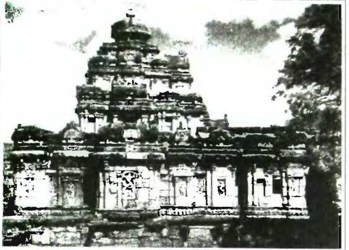
ವಿರೂಪಾಕ್ಷ ದೇವಾಲಯ, ಪಟ್ಟದ ಕಲ್ಲು